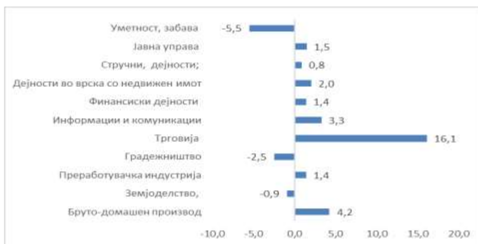
Графикон број 1 – Бруто домашен производ, приходна страна (2021)

Пандемијата на Ковид-19 предизвика пад на економијата на Северна Македонија од 6,1% во 2020 година. Притоа, опоравувањето од пандемијата е со побавно темпо од очекуваното. Имено, во 2021 година, според прелиминарните податоци на Државниот завод за статистика, растот на БДП изнесува 4%, што всушност значи дека македонската економија сеуште го нема достигнато пред-кризното ниво од 2019 година. Основна причина за нискиот интензитет на економско закрепнување се пролонгираната здравствена криза, како и нарушените синџири на снабдување. Економското закрепнување во 2021 година во најголем дел доаѓа од трговијата, додека останатите гранки забележуваат минимален раст или намалување (види Графикон 1).